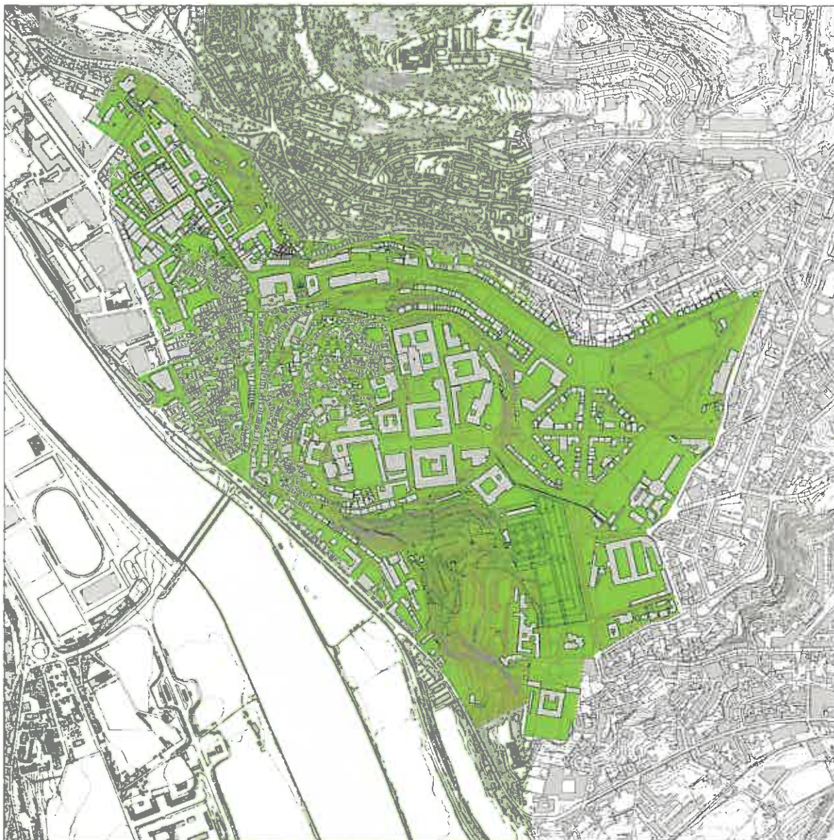
Carta nº 1 - Planta da Área afectada ao Regulamento