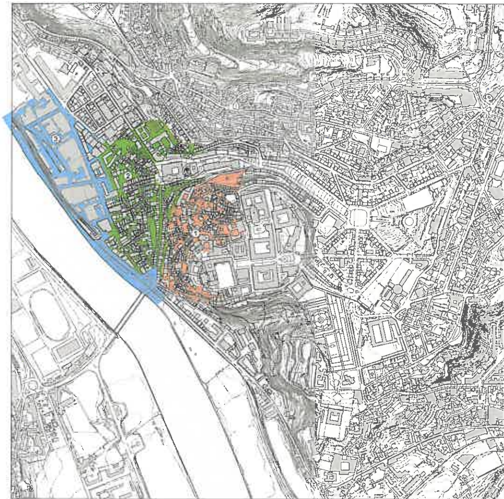
Carta nº 3 - Planta de Identificação das Áreas de Reabilitação Urbana