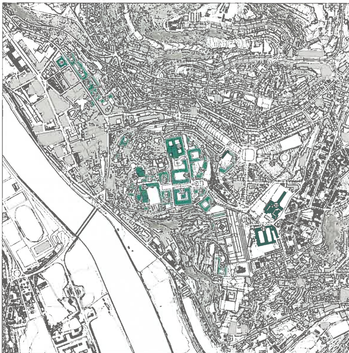
Carta nº 4 - Planta de Identificação dos Edifícios